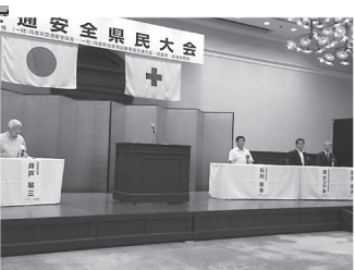
▲総務常任委員長として交通安全県民大会に出席