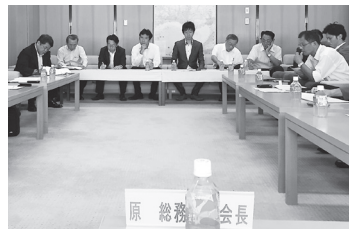
▲自民党県議団は数十団体の方から予算要望をお受けして県政に反映させています