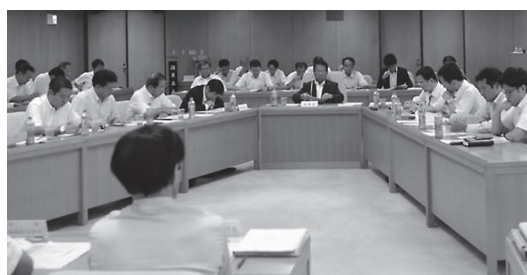
総務常任委員長として地域創生の施策を取りまとめ