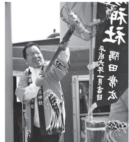
▲岩屋浜芝居で鯛の放流