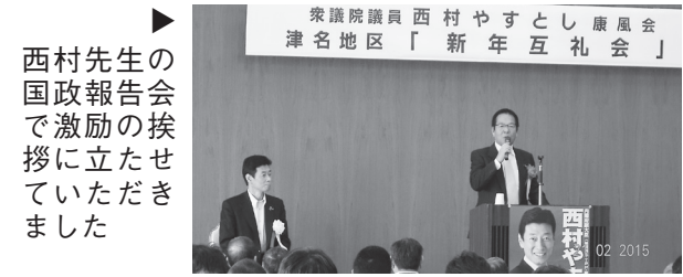
▶ 西村先生の国政報告会で激励の挨拶に立たせていただきました