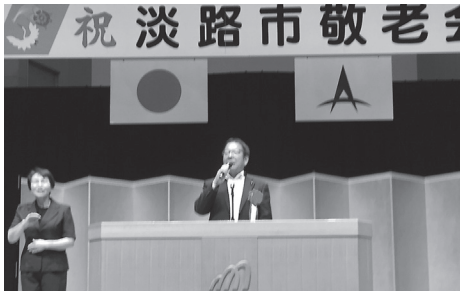
淡路市敬老会 で人生の先輩方々 にご挨拶