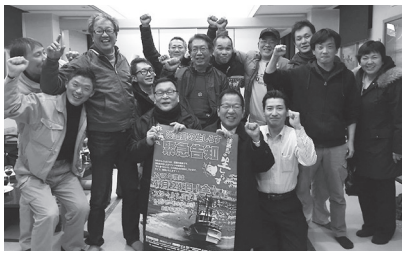
北ブラ協会の生シラス井は 今や全国ブランド

海難事故の防止では、海上保安庁や漁業団体と連携して研修会の開催をはじめ、救命胴衣や県漁連が開発した浮力カップの着用推進など、操業の安全確保に努めていく。