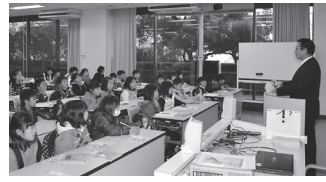
市内淡路市にきた来客見学を前に小学生の県庁見学の小学生