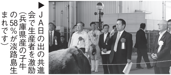
▶ J A 日の出の共進 会で生産者を激励 (兵庫原産の子牛 の58%が淡路島生 まれです)