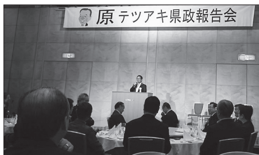
恒例の県政報告会を昨年10月にウエストインホテル淡路で開催しました

くりと食事をして頂くのも良いかも知れないというところで、食事しながら友人の歌を楽しんで頂きました。