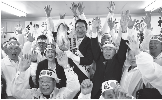
▲ 27年4月の統一地方選挙で3期目の当選を果たしました