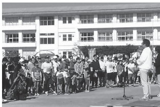
▲淡路国生みマラソンに 2千人が出走