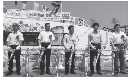
▶ 北淡路地区の生命線ジェノバラインに新造船(国、県、市の合作です)