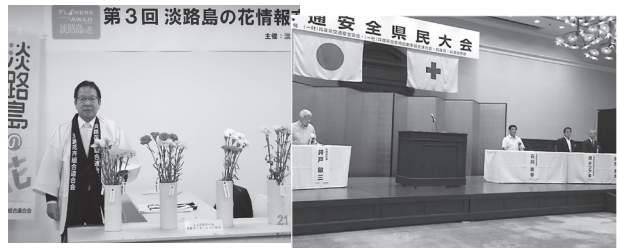
▲花市場や花店の皆様と花き生産者との情報交換会(淡路花き連会長として)