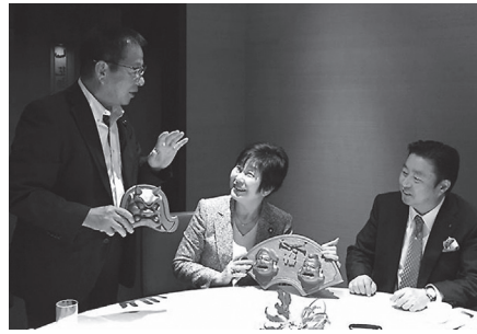
▲ 山東先生に淡路島をPRするため淡路産の鬼瓦をプレゼント