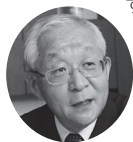
T Vでお馴染みの政治評論家、田崎史郎氏

大晦日に準備し、2日まで家族と支援者で活動。 ☆28年度も計画をします。 ☆平成28年度の県政報告会は4月23日(土)午後2時~4時から田崎史郎氏を迎えて開催します。